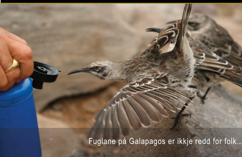
Fuglane på Galapagos er ikkje redd for folk...

Å fly ut til Galapagos tar ca 3 timar og vi reiser tidleg frå hotellet til flyplassen neste dag. Når vi har landa (på øya Baltra) tar vi buss over øya, og båt til Santa Cruz, til landsbyen Puerto Ayora. Der skal vi bu på eit hotell midt i landsbyen. Ettermiddagen brukar