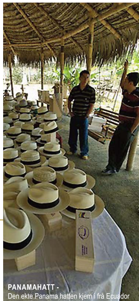
PANAMAHATT - Den ekte Panama hatten kjem í frá Ecuador

Dei som har vore i jungelen held fram med sin tur om formiddagen. Utpå dagen kjem denne gruppa tilbake, får lunsj på hotellet, og rekk eit bad. På ettermiddagen øver vi litt, og om kvelden kan vi samlast til båkveid på elvebreidda, evt sjå oss litt meir rundt i landsbyen, eller berre slappe av.